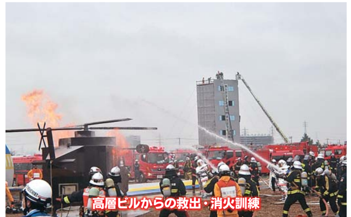
高層ビルからの救出・消火訓練