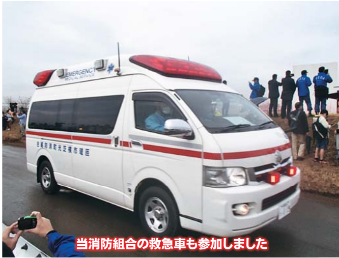
当消防組合の救急車も参加しました

平成27年11月13日(金)14日(土)の2日間に渡り、総務省消防庁の主催で5年に1度実施される第5回緊急消防援助隊全国合同訓練が千葉県市原市をメイン会場に開催されました。当日はあいにくの雨にもかかわらず、全国各地の消防本部、自衛隊、警察、医療機関、各関係機関等、総勢約2,500人が参加協力のもと盛大に行われました。北は北海道から南は沖縄まで、全国各地の消防本部の精鋭部隊、約600隊が集結し、大規模な火災やビルの倒壊、土砂災害などの実災害を想定した訓練で約3時間以上にも及び、各訓練部隊には、訓練内容が明かされない完全ブラインド形式により実施されました。さまざまな特殊車両やヘリコプター等も参加し、遠距離の陸路部隊にあっては、11日に地元消防本部を出発し、13日よりの訓練の為、宿営をしながら参集するという過酷な訓練を行いながらの実施でありました。